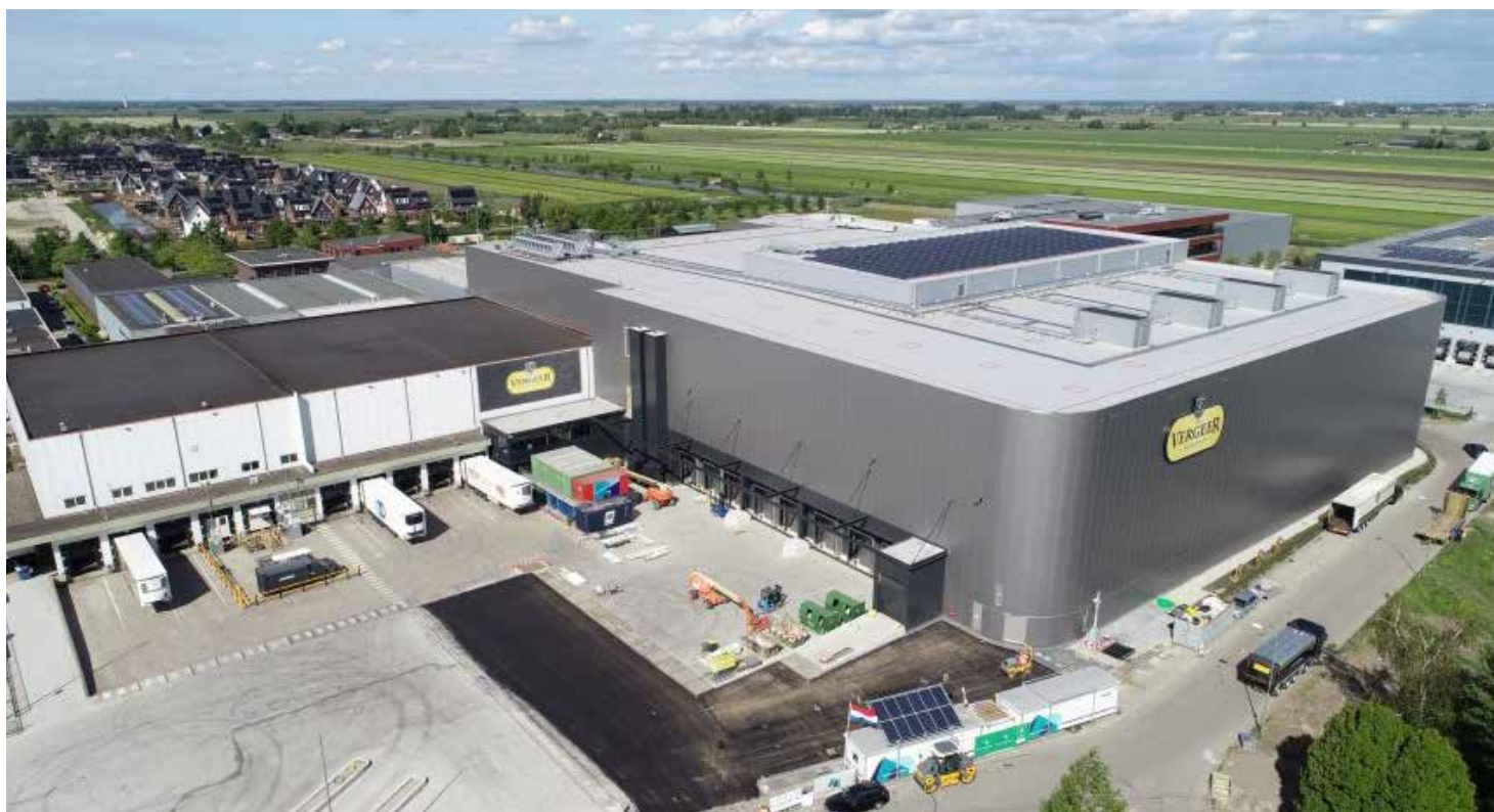
Uitbreiding van Vergeer Holland in Bodegraven.